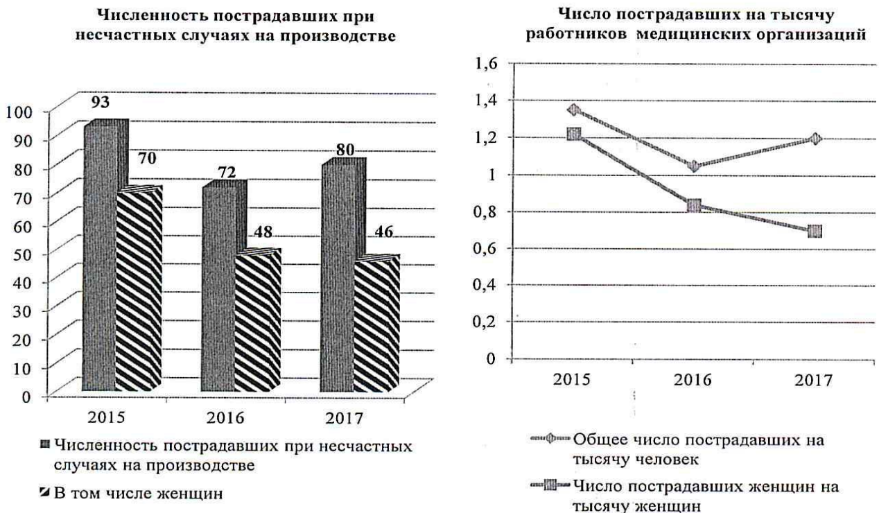
Рис. 2 Уровень производственного травматизма

Уровень производственного травматизма определяется числом пострадавших при несчастных случаях на 1000 работающих. В 2017 году при общем количестве пострадавших 80 человек, этот показатель составил 1,2 (Рисунок 2).