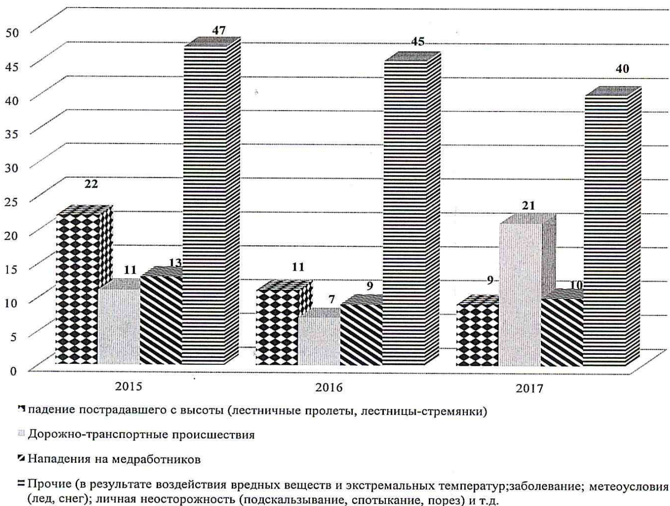
Рис. 3 Структура несчастных случаев

Структура несчастных случаев по видам представлена на Рисунке 3.